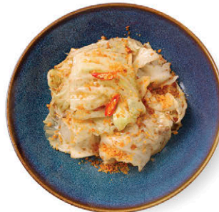
C21 กะหล่ำปลีออร์แกนิก ผัดน้ำปลา 125.- Stir-fried Cabbage with Fish Sauce