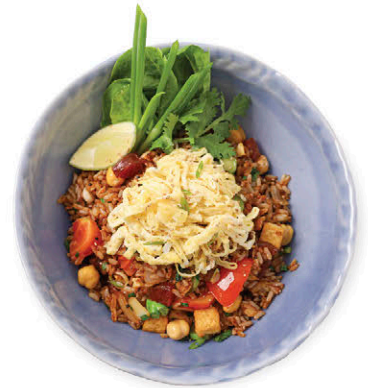
ข้าวผัดรตไฟโซ่ Dark Soy Sauce Fried Rice with Shredded Omelette M11 สูตรธอ (Vegetarian) 120.- M12 กุนเชียงไข่ (Chinese Sausages & Shredded Omelette) 135.-