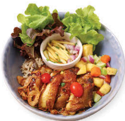
M15 ข้าวไก่ย่างขมิ้น 155.- Grilled Turmeric Chicken with Rice & Quinoa