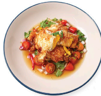
C6 ยำไข่ดาวอารมณ์ดี Thai Spicy Salad with Fried Free-range Eggs