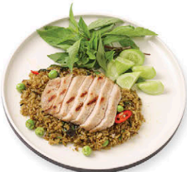
M14 ข้าวผัดเขียวหวาน อกไก่ย่าง 165.- Stir-fried Green Curry with Rice and Grilled Chicken Breast