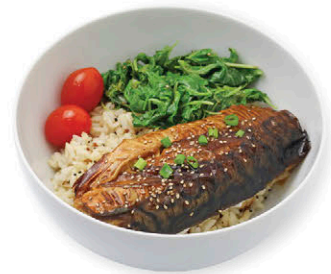
ข้าวปลาซาบะย่าง 198.- ซอสเทริยากิ Grilled Teriyaki Saba with Rice & Quinoa