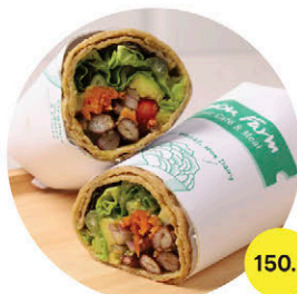
W4 อะโวกาโด Avocado