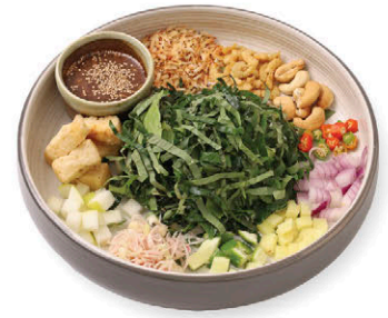
A3 ยำมี่ยงเต้าหู้ 125.- "Yum-Miang" with Tofu V