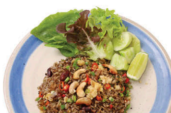
M20 ข้าวผัดหน้าเลียบ 125.- Salted Black Olive Fried Rice