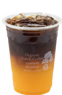
อเมริกาโน ส้มสายน้ำผึ้ง