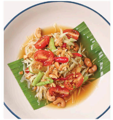
C7 ส้มตำไทย มะละกอออร์แกนิก Organic Thai Green Papaya Salad (Som Tam)