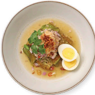
C5 ยำมะเขือยาวหมูหุ่บ Thai Spicy Eggplant Salad with Minced Natural Pork