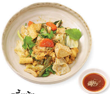
สุกี้แห้ง Thai Stir-fried Sukiyaki (Dry) N1 เต้าหู้ (Tofu) 135.- N2 หมู (Pork) 165.-