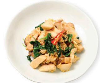
C24 เห็ดออร์อินจิผัดไข่ 135.- Stir-fried Eryngii Mushroom with Free-range Egg