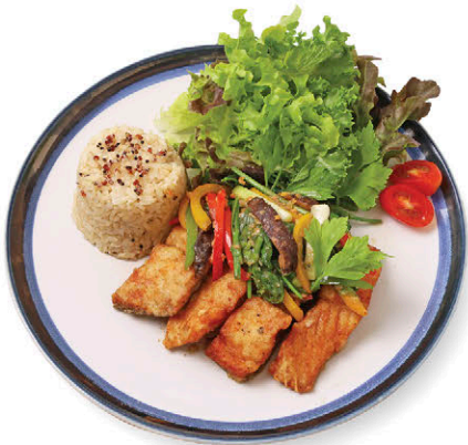
M3 ข้าวปลาไนผัดขึ้นฉ่าย 175.- Stir-fried Tilapia with Chinese Celery & Rice and Quinoa