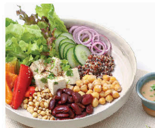
S11 สลัดธัญพืชรวม 135.- (V) Mixed Grains Salad (Japanese Sesame Dressing)