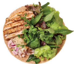
W7 หมูหลุมย่างจิ้มแจ่ว Grilled Natural Pork with Thai Spicy Sauce