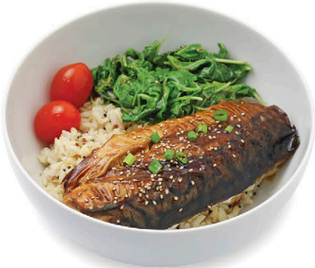
M1 ข้าวปลาซาบะย่างซอสเทอริยากิ 198.- Grilled Teriyaki Saba with Rice & Quinoa

ปลาปลอดฟอร์มาลีน เนื้อแน่น นุ่ม ตามธรรมชาติ เลี้ยงหรือทำประมงด้วยวิธีอนุรักษ์