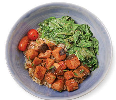
M8 ข้าวแซลมอนธรรมชาติ 230.- ซอสเทอริยากิ Teriyaki Wild Salmon with Rice & Quinoa