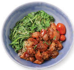
M13 ข้าวอกไก่ย่างเทอริยากิ 155.- Teriyaki Grilled Chicken Breast with Rice & Quinoa