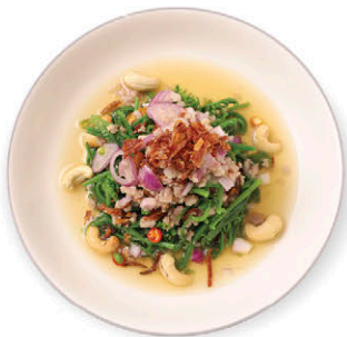
ยำผักกูดหมูสับ 135.- Paco Fern Salad with Minced Pork