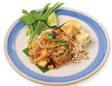
ผัดไทยพอดี้ พอดี้ Pad Thai N5 เต้าหู้ (Tofu) 135.- (V) N6 กุ้ง (Shrimp) 220.-