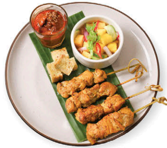
A2 ไก่สะต๊ะสมุนไพรม 110.- Thai Chicken Satay