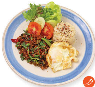
ข้าวทะเลพร้าหมูหลุม 155.- 10 สมุนไพร ไข่ดาว Stir-fried Pork and "10 Herbs" with Rice, Quinoa & Fried Egg