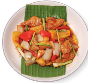
C16 หมูผัดเปรี้ยวหวาน 145.- Stir-fried Natural Pork with Sweet & Sour Sauce