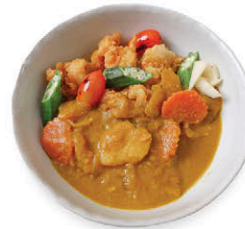
M17 ข้าวแกงกะหรี่โฮมเมดไก่ป๊อป 165.- Homemade Japanese Curry with Rice & Chicken Pops