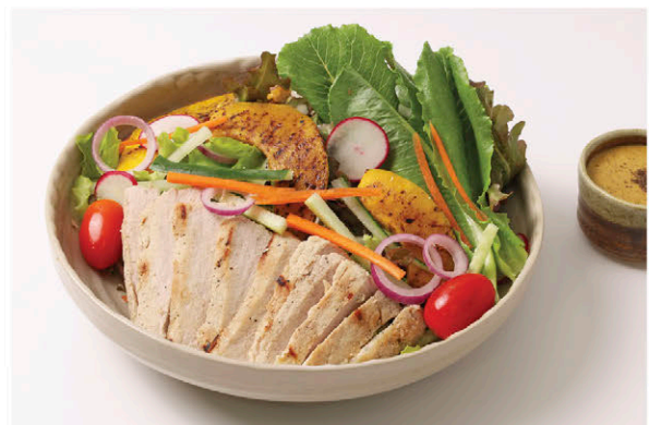
S5 สลัดหมูหลุมพริกไทยดำ 175.- Black Pepper Natural Pork Salad (Black Pepper Dressing)