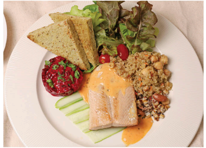
T6 เซตแซลมอนย่างเนื้อนุ่ม 375.- ราคาขายหมด SOLD OUT Grilled Wild Salmon / Butter-Fried Quinoa & Grains / Beetroot Salsa / Kale Bread