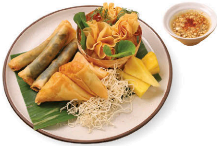
A1 ปอเปี๊ยะทอด 3 สหาย 125.- (ผักโขม รุ้นเส้นเห็ดหอม มันหวาน) Fried Spring Rolls with 3 Fillings (Spinach / Glass Noodles with Mushroom / Sweet Potato)