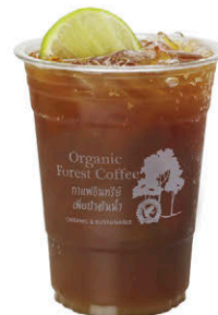
เอสเปรสโซ่ มะนาวโซดา