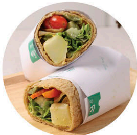
W1 ผักย่าง Grilled Vegetables