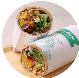
W2 ธัญพืชรวม Mixed Grains