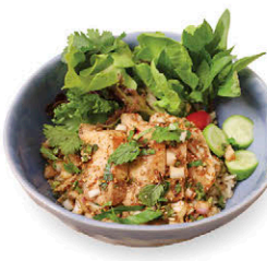
M18 ข้าวลาบอกไก่แซ่พอดี พอดี 155.- Pordee Pordee's Spicy Grilled Chicken Breast with Rice