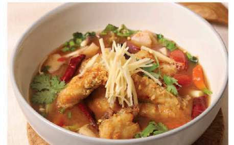
C10 แกงรัญจวนปลาไหลทอด Fried Tilapia Curry (Seasoned with Fermented Shrimp Paste Chilli Sauce)