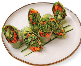
A6 โรลผักออร์แกนิก 95.- น่ายำเวียดนาม Vegetable Spring Rolls with Vietnamese Dipping Sauce V