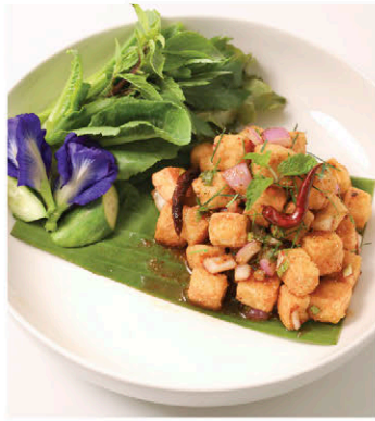
C2 ลาบเต้าหู้เต้า Thai Spicy Tofu Salad