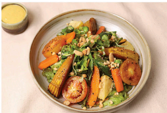
S8 สลัดผักรวมมิตรย่าง 175.- Grilled Mixed Vegetables Salad (Mayonnaise Dressing)

ผักผลไม้แต่ละสี มีไฟโตนิวเทรียนท์และสรรพคุณต่อร่างกายที่แตกต่างกัน เราจึงควรทานผัก ผลไม้ ที่มีสีหลากหลาย เพื่อให้ได้โภชนาการที่ครบถ้วน เช่น ในจานสลัดรวมมิตรผัก 5 สีนี้