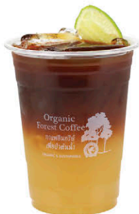
อเมริกาโน น้ำผึ้งมะนาว