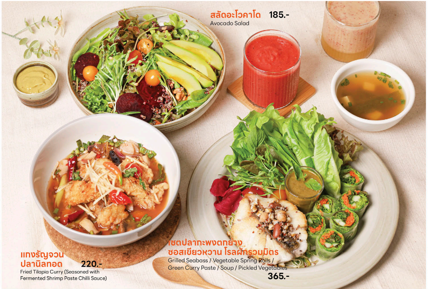
สลัดอะโวคาโด 185.- Avocado Salad