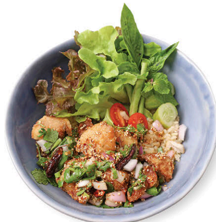
M4 ข้าวลาบปลาไน 175.- กินข้าว Thai Spicy Fried Tilapia Salad with Rice