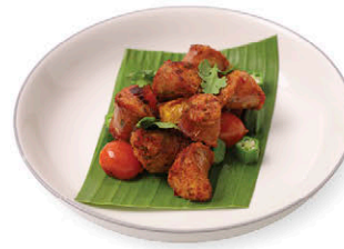
A5 ไส้จิ้งหรีดย่าง 120.- Grilled Northern Thai Sausages