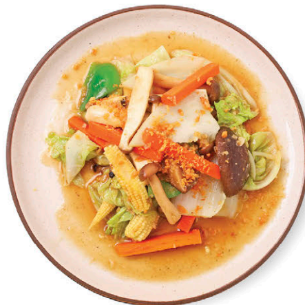
C20 ผัดผักออร์แกนิกรวม 95.- Stir-fried Organic Vegetables