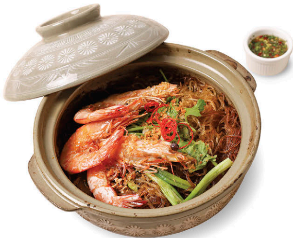
N1 กุ้งแชบ๊วยอบเส้นเส้น 265.- Baked Banana Shrimps with Noodles