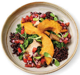
สลัดเคลข้าวทำดอย 195.- ฟักทองและเห็ดย่าง ราดซาลซ่า Grilled Mushroom & Pumpkin with Black Sticky Rice Kale Salad (Salsa Dressing)