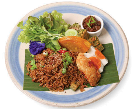
M5 ข้าวผัดน้ำพริกทองเรือ 230.- ทรงเครื่อง ปลาไนทอด Thai Spicy Shrimp Paste with Rice, Sweet Pork and Fried Tilapia