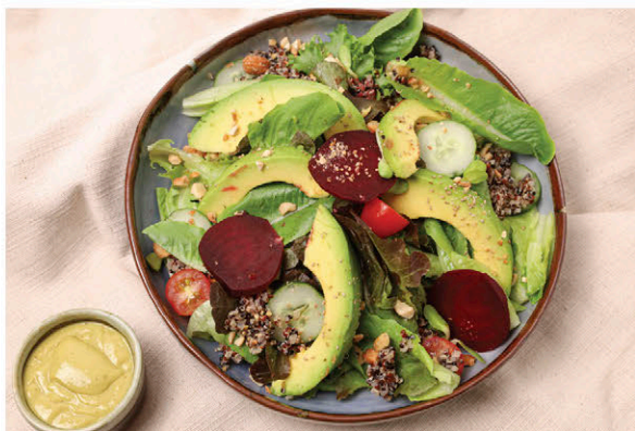
S10 สลัดอะโวคาโด 185.- Avocado Salad (Avocado Mayonnaise Dressing)