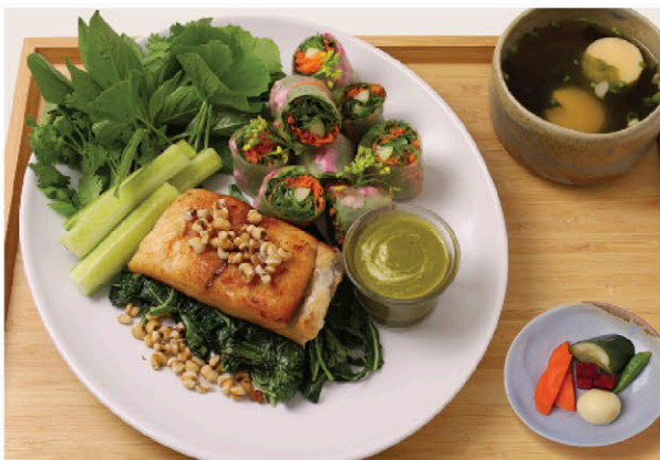
T3 เซตปลาทะพงตกย่าง ซอสเขียวหวาน ไส่ผักรวมมิตร Grilled Seabass / Vegetable Spring Rolls / Green Curry Paste / Soup / Pickled Vegetables