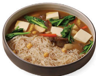
ราดหน้าหมี่กลิ้ง Stir-fried Brown Rice Vermicelli N7 เฝือกวมธัญพืช 125.- (V) (Grains & Mushrooms) N8 หมูบ่ม (Pork) 145.-