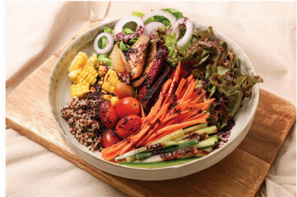
S7 สลัดผักเรนโบว์ 5 สี บัลซามิกหม่อน 175.- "Rainbow" Mixed Veggies Salad (Mulberry Balsamic Dressing) (V)

ข้าวดำทอดมีแอนโทไซยานิน ต้านอนุมูลอิสระ ลดการอักเสบและความเสี่ยง การเกิดโรคอย่างมะเร็งและหัวใจ