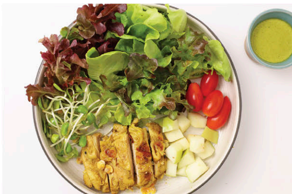
S4 สลัดไก่ย่างขมิ้น 185.- Grilled Turmeric Chicken Salad (Seafood Mayonnaise Dressing)