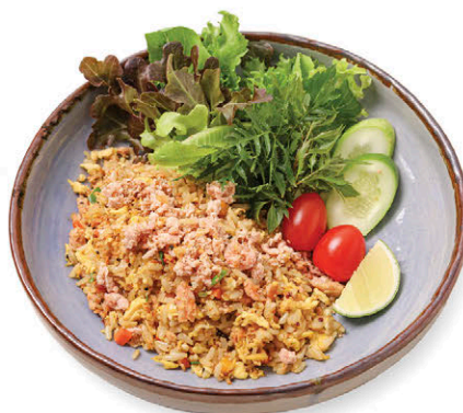
M6 ข้าวผัดกระเทียม 155.- แซลมอนธรรมชาติ Garlic and Egg Fried Rice with Wild Salmon