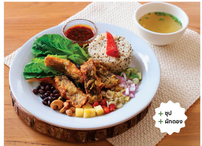
T8 เซตปลาบิลทินข้าวลุยสวน 235.- Fried Organic Tilapia with Spicy Herb Dressing / Rice & Quinoa / Soup