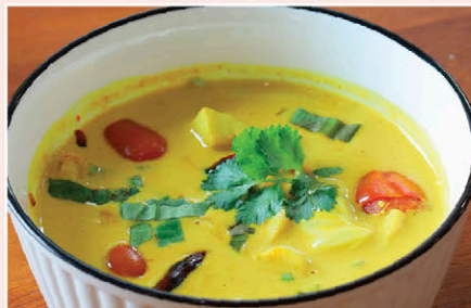
C11 ต้มข่าไก่ขมิ้น Turmeric Chicken Coconut Soup ขมิ้นและสมุนไพร ทั้งตะไคร้ ข่า หอมแดง มะกูด อาจมีส่วนช่วย ต้านอนุมูลอิสระ และต้านหวัด