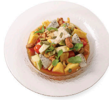
C8 ตำผลไม้ฤดูกาล Thai Spicy Seasonal Fruits Salad