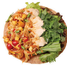
W9 ส้มตำไก่ย่าง Grilled Chicken with Som Tam