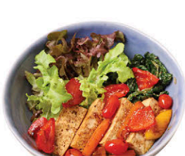
M22 ข้าวเต้าหู้นุ่มเทอริยากิ 145.- Tofu with Teriyaki Sauce and Rice