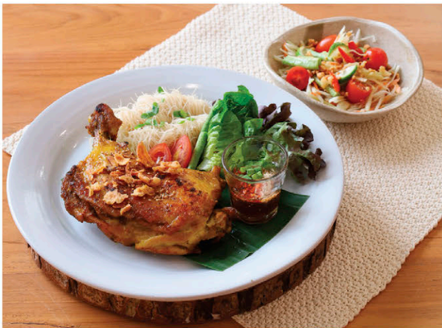
T9 เซตส้มตำไก่ขมิ้นย่าง โรลข้าวทำดอย 235.- Grilled Turmeric Chicken / Som Tam / Sticky Rice Rolls Set