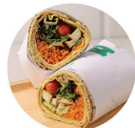
W6 อกไก่ย่าง Grilled Chicken Breast