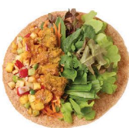
W8 ไก่สะเต๊ะ Thai Chicken Satay