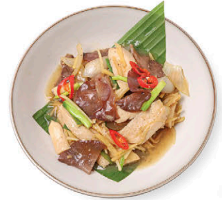
C17 ไก่ผัดขิงใส่ลม 145.- Stir-fried Chicken with Ginger