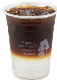
อเมริกาโน มะพร้าวน้ำหอม