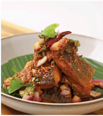
C1 ลาบปลาอินทิลกับข้าว Thai Spicy Organic Tilapia Salad (Laab Pla Nil)