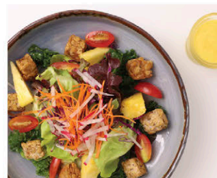
S12 สลัดเทมเปี้ย่าง 135.- Grilled Tempeh Salad (Mayonnaise Dressing)