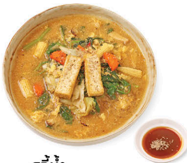
สุกี้น้ำ Thai Stir-fried Sukiyaki (Soup) N3 เต้าหู้ (Tofu) 135.- N4 หมู (Pork) 165.-