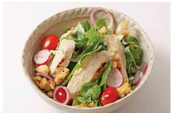
S3 ซีซาร์สลัดอกไก่ย่าง 165.- Caesar Salad with Grilled Chicken Breast