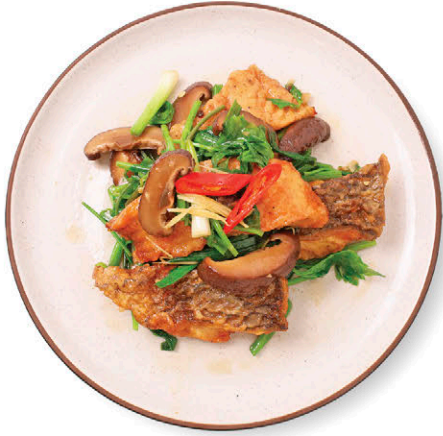
C15 ปลาชนิดผัดขึ้นฉ่าย 175.- Stir-fried Tilapia with Chinese Celery