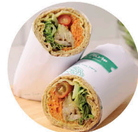
W5 หมูหลุมย่าง Grilled Natural Pork