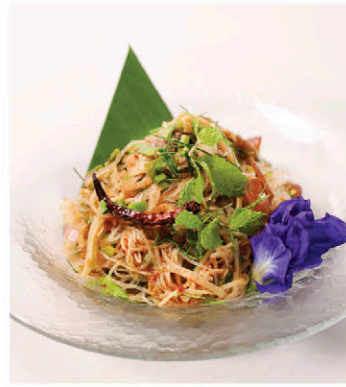
C3 ลาบเห็ดรวมวุ้นเส้น Thai Spicy Mixed Mushrooms Salad with Glass Noodles