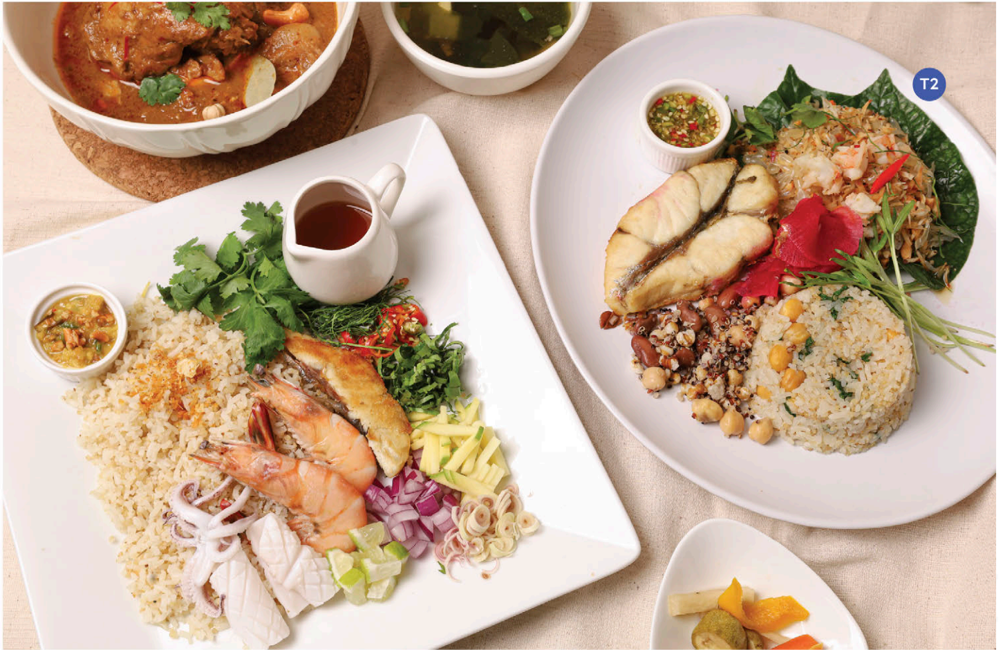
T1 เซตข้าวมันยำซีฟู้ด Grilled Seabass / Coconut Rice Banana Shrimps & Splendid Squids Thai Spicy Sauce / Seafood Dipping Sauce