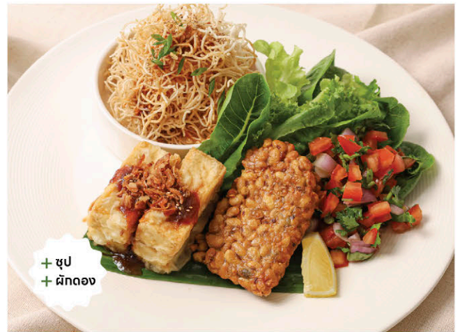
T10 เซตเต้าหู้ทอดซอสมะขาม เหมเปี้ยว 245.- ราคาขายหมด SOLD OUT Fried Tofu with Tamarind Sauce / Herb Salsa Sweet & Sour Crispy Noodles / Soup / Pickled Vegetables