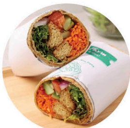
W3 เทมเป้ Tempeh