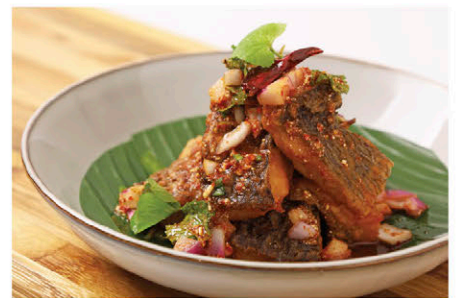
ลาบปลาบิลอออร์แกนิก 185.- Thai Spicy Organic Tilapia Salad (Larb Pla Nii)