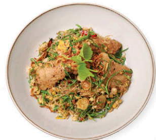
N10 หมี่ซอมนหมูหมัก 165.- Stir-fried Vermicelli with Fermented Pork and Acacia Leaves