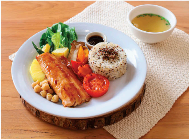
T5 เซตแซลมอนเทอริยากิ ผักย่าง 335.- Teriyaki Wild Salmon / Grilled Vegetables / Brown Rice with Quinoa / Soup