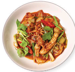
C19 หมึกกล้วยผัดไข่เค็ม 195.- Stir-fried Splendid Squid with Salted Egg