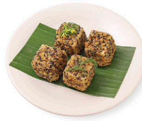
A7 เต้าหู้ทอดคลุก 3 งา 85.- ซอสมะขาม Triple Sesame Fried Tofu with Tamarind Sauce V