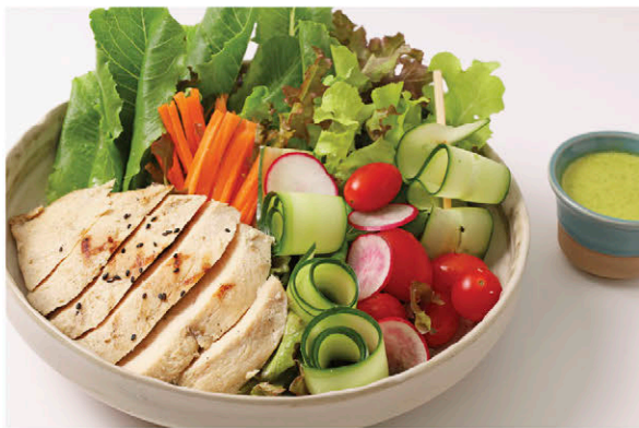
S2 สลัดอกไก่ย่าง 175.- Grilled Chicken Breast Salad (Seafood Mayonnaise Dressing)