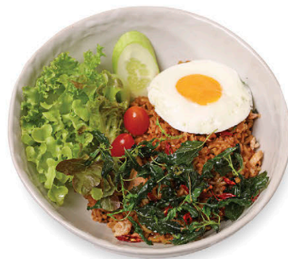
M7 ข้าวกะเพราคลุก 155.- แซลมอนธรรมชาติ Holy Basil Fried Rice with Wild Salmon