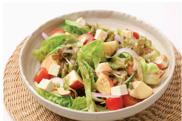
S9 สลัดแอปเปิ้ลออร์แกนิกเต้าหู้อ่อน 135.- Organic Apple & Tofu Salad (Japanese Sesame Dressing)