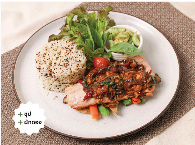
T7 เซตทะเลพราเซลมอนย่าง 375.- Grilled Salmon with Holy Basil Sauce / Rice & Quinoa Grilled & Pickled Vegetables / Spicy Cucumber Salad / Soup