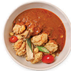
M16 ข้าวมัสมั่นอินเดีย 165.- Indian Curry with Rice & Chicken Pops SOLD OUT