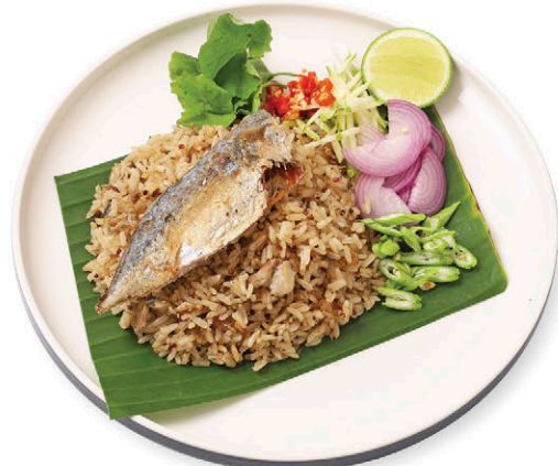
M2 ข้าวคลุกปลาทุ 155.- Spicy Mackerel Salad with Rice