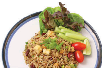
M19 ข้าวผัดนานาธัญพืช 110.- Mixed Grains Fried Rice