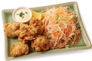
A4 ไก่ป๊อป พอดี้ พอดี้ 90.- Pordee Pordee's Chicken Pops