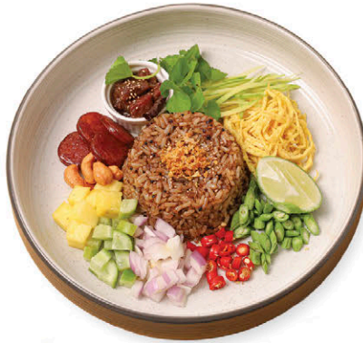
M10 ข้าวคลุกกะปิ 135.- Shrimp Paste Fried Rice