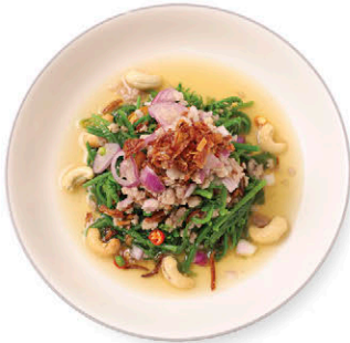
C4 ยำผักกูดหมูหุ่บ Paco Fern Salad with Minced Natural Pork