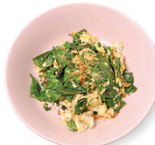
C23 ใบเหลียงผัดไข่ อารมณ์ดี 135.- Stir-fried Malindjo Leaves with Free-range Egg