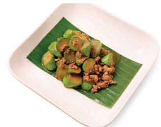
C22 มะเขือยาวออร์แกนิก ผัดเต้าเจี้ยว 135.- Stir-fried Organic Eggplant with Soybean Paste Sauce