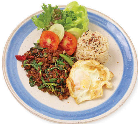
M9 ข้าวกะเพราหมูกลม 10 สมุนไพร ไข่ดาว Stir-fried Pork and "10 Herbs" with Rice, Quinoa & Fried Egg