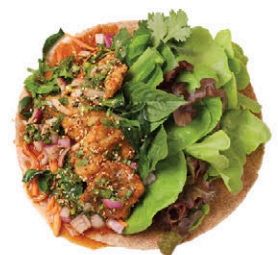
W10 ลาบปลาฉี่ Thai Spicy Tilapia Salad (Laab)