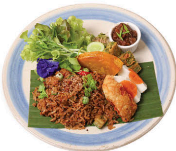
ข้าวผัดน้ำพริกทองเรือ 230.- ทรงเครื่อง ปลาบิลอก Thai Spicy Shrimp Paste with Rice, Sweet Pork and Fried Tilapia