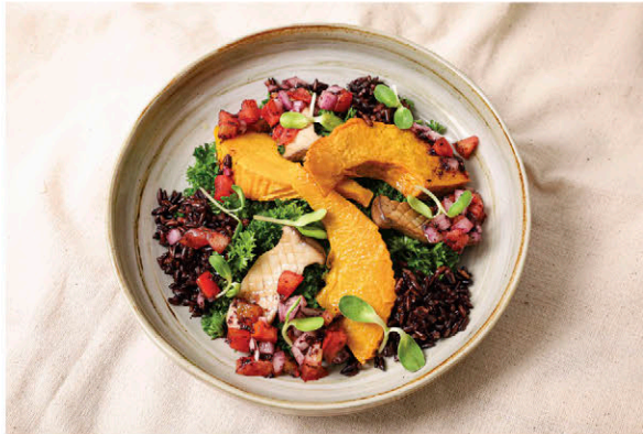
S6 สลัดเคลข้าวดำทอด ฟักทองและเห็ดย่าง ราดซัลซ่า 195.- Grilled Mushroom & Pumpkin with Black Sticky Rice Kale Salad (Salsa Dressing) (V)