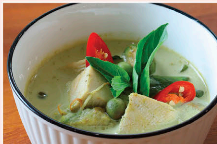
C12 แกงเขียวหวานอกไก่ Chicken Breast Green Curry โปรตีนดี มีกระชาย โหระพา มีส่วนช่วยขับลม ทำให้เจริญอาหาร และเสริมภูมิคุ้มกัน