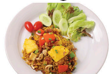
M21 ข้าวผัดสับปะรด 125.- Pineapple Fried Rice