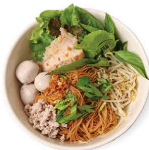
N9 หมี่คลุกลูกชิ้นหมู 125.- ปลอดสาร Organic Rice Vermicelli with Sauce and Pork Balls